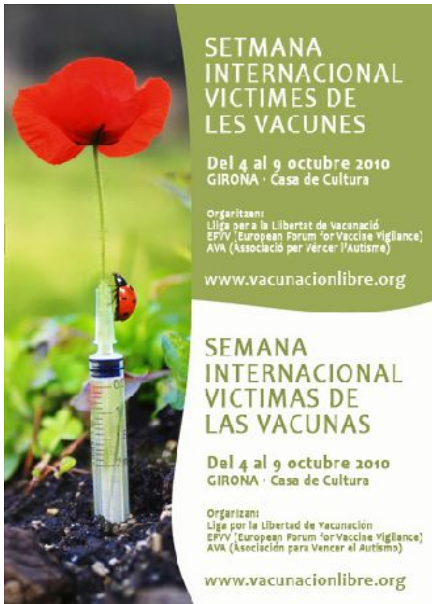
IMAGEN Y CARTEL 2010